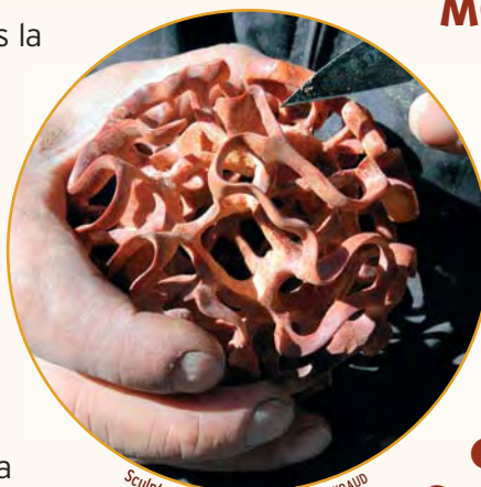
Sculpture A. Mailland