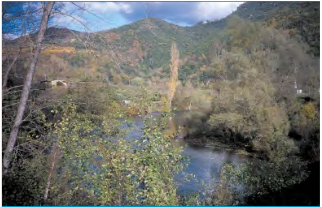
Une faune et une flore intéressantes, liées aux cours d'eau.

à pente forte ou très forte portent des sols superficiels et pauvres où la roche peut affleurer. Les versants exposés au sud sont plus secs que ceux exposés au nord. Les incendies y sont plus fréquents et la végétation a plus de mal à se réinstaller, surtout s'ils ont été surpâturés autrefois. L'érosion est donc plus forte et les sols sont souvent superficiels. En revanche, les terrasses de culture (« bancels » ou « faïsses ») bâties par l'homme, sur lesquelles la terre est retenue par un muret de pierres sèches, constituent des replats artificiels où les sols sont profonds mais souvent filtrants.