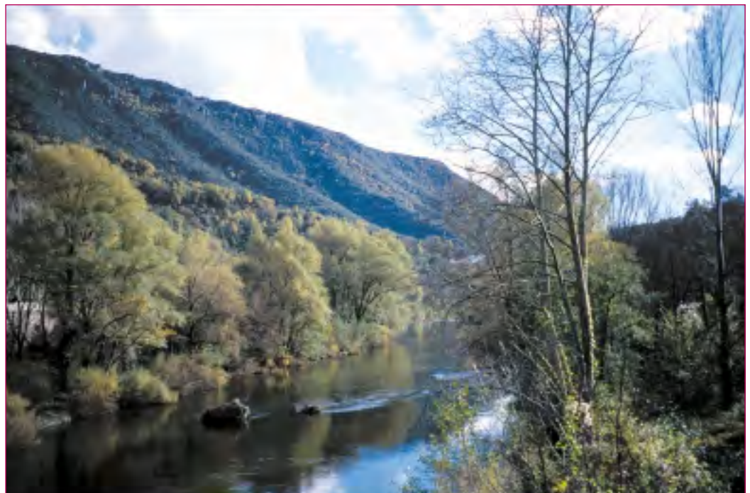
L'entretien des ripisylves permet de lutter contre les crues, de préserver les espèces et les habitats liés aux cours d'eau.