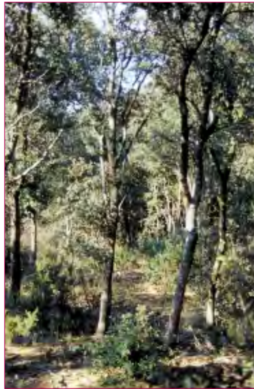
Le traitement des chênaies vertes en taillis simple permet de produire du bois de chauffage.

Les objectifs sont choisis par le propriétaire. Il en a souvent plusieurs et, pour assurer une compatibilité entre eux et une cohérence dans la gestion, les traitements et les interventions doivent en tenir compte pour que chaque objectif puisse être atteint. Deux objectifs peuvent être poursuivis simultanément : par exemple, on peut très bien produire du bois en réalisant des interventions avec un objectif de départ différent. De même, la protection du milieu naturel ou du patrimoine