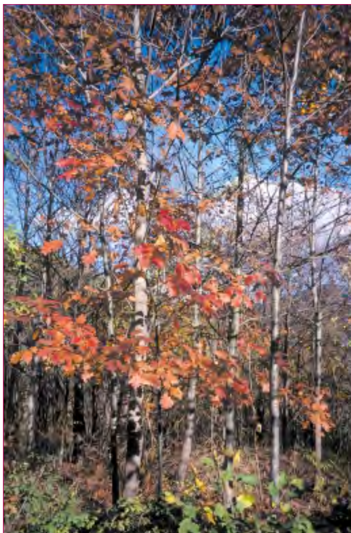
Le chêne rouge d'Amérique peut être planté sur les terrains profonds sans calcaire actif.