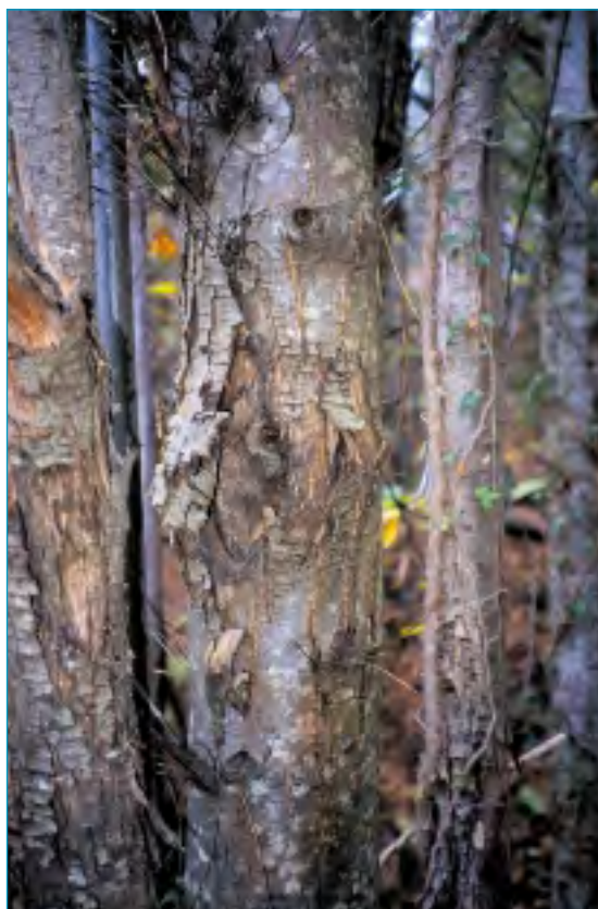
Le chancre du châtaignier est présent dans la plupart des peuplements.

Sur les feuillus, le principal agent est le chancre du châtaignier ( Cryphonectria parasitica ) qui est présent dans la plupart des peuplements, surtout à basse altitude, en dessous de 600 à 700 mètres. L'affaiblissement des arbres dû à l'abandon des peuplements qui s'ajoute souvent à leur inadaptation aux stations où ils ont été plantés, peut favoriser le développement du parasite qui provoque à terme la mort des brins attaqués. L'encre ( Phytophthora cinnamomi ), maladie cryptogamique présente dès 1871 dans les Cévennes, a pris de l'ampleur après l'abandon de surfaces importantes de vergers au début du siècle.