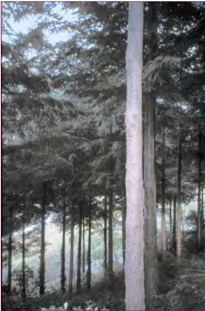
L'éclaircie des peuplements et l'égagage des plus beaux arbres permettront de produire, à l'avenir, du bois d'œuvre.

essences mais on n'a aucune certitude sur l'avenir des plants protégés. Enfin le suivi (dégagements, tailles de formation) est impératif, aussi bien pour les plants introduits que pour les semis naturels d'essences intéressantes (chêne, hêtre, feuillus précieux) qui pourront ainsi être favorisés.