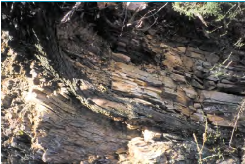
La pénétration des racines entre les feuillets des schistes permet à l'arbre de tirer parti des ressources profondes du sol.

Les précipitations : les Basses-Cévennes constituent le premier obstacle sur lequel se déversent les masses d'air humides venues de la Méditerranée. Ceci explique l'importante pluviosité annuelle : 1459 mm au Vigan à 250 mètres, 1413 mm à Lasalle à 278 mètres et 1411 mm à Saint-André-de-Valborgne à 450 mètres d'altitude. Les saisons les plus arrosées sont l'automne et l'hiver (chacune le tiers du total annuel). Le déficit hydrique estival est fortement marqué (les précipitations d'été représentent 10 à 15% du total annuel) avec un minimum très net en juillet, mois le plus chaud. Les orages sont fréquents et fournissent l'essentiel des précipitations estivales. Elles ne profitent pratiquement pas à la végétation car elles ruissellent et ne pénètrent pas dans le sol. Tout au long de l'année, les pluies peuvent être violentes et provoquer des crues dévastatrices. La neige en hiver, et les brouillards au printemps et à l'automne, peuvent toucher la frange la plus élevée des Basses-Cévennes mais ils restent rares sur la majeure partie de la région.