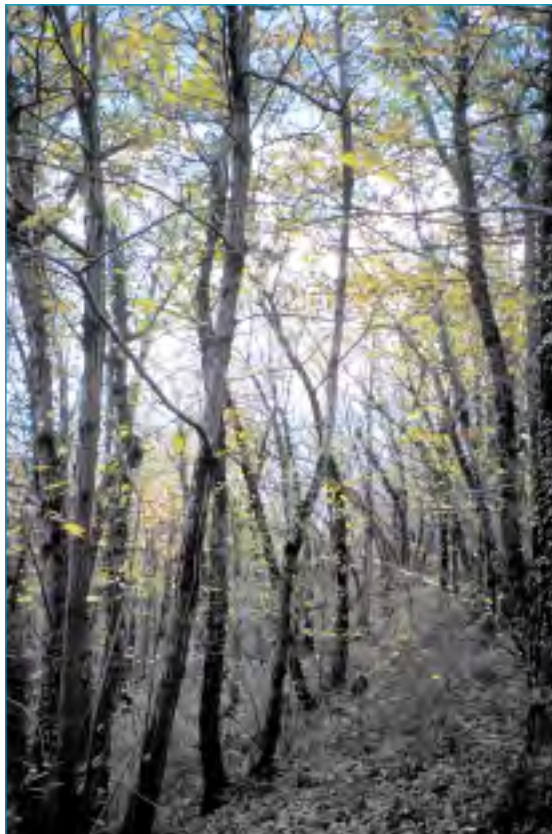
Le châtaignier couvre près de la moitié de la surface boisée.