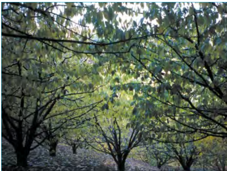
L'arboriculture (ici cerisiers) est pratiquée localement.

Les vallées des gardons ont également fait l'objet d'inventaire au titre des Zones naturelles d'intérêt écologique, faunistique et floristique (ZNIEFF). Nota : ZNIEFF et ZICO sont des inventaires et nullement des zones bénéficiant de protection réglementaire mais ils servent de base à l'élaboration de nombreux documents (notamment pour la mise en place du réseau Natura 2000). Il peut toujours être intéressant pour les propriétaires de prendre connaissance de ces documents avant de prendre une décision de gestion.