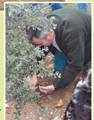
► Cavage avec chien truffier