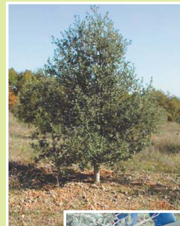
◀ Brûlé sous chêne vert

Une station ou micro-station truffière est une zone homogène pour ce qui est des facteurs de croissance des arbres et de l'écosystème truffier.